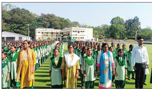
आयोजन नहीं, बल्कि भारत की राष्ट्रीय अस्मिता, सांस्कृतिक गौरव और मातृभूमि के प्रति समर्पण का प्रतीक बन गया। इस विशेष

रांची : भारत के राष्ट्रीय गीत 'वंदे मातरम' की रचना को 150 वर्ष पूरे होने पर शुक्रवार को झारखंड शिक्षा परियोजना परिषद की ओर से राजधानी रांची सहित राज्य के सभी सरकारी स्कूलों में एक साथ सामूहिक रूप से राष्ट्र गीत गाया गया।